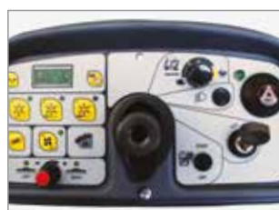
CUADRO DE MANDOS