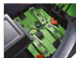
ALOJAMIENTO DE BATERÍAS (PARA 1050 E)