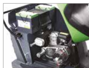
DUAL POWER (PARA 1050DP)