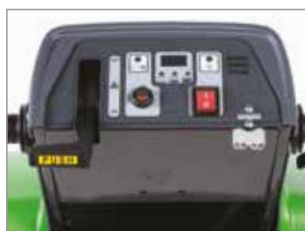
PANEL DE CONTROL INTUITIVO