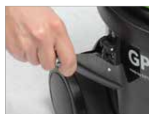
GANCI ESTREMAMENTE FLESSIBILI